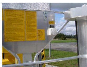
230 V udtag i kurv